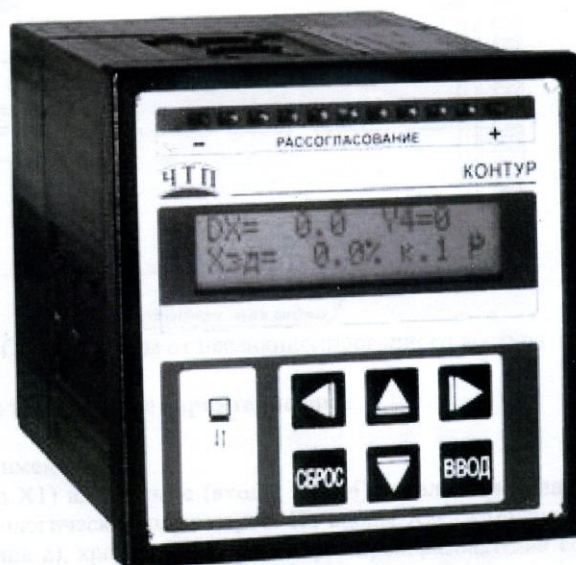
Рисунок 1 – Общий вид регулятора